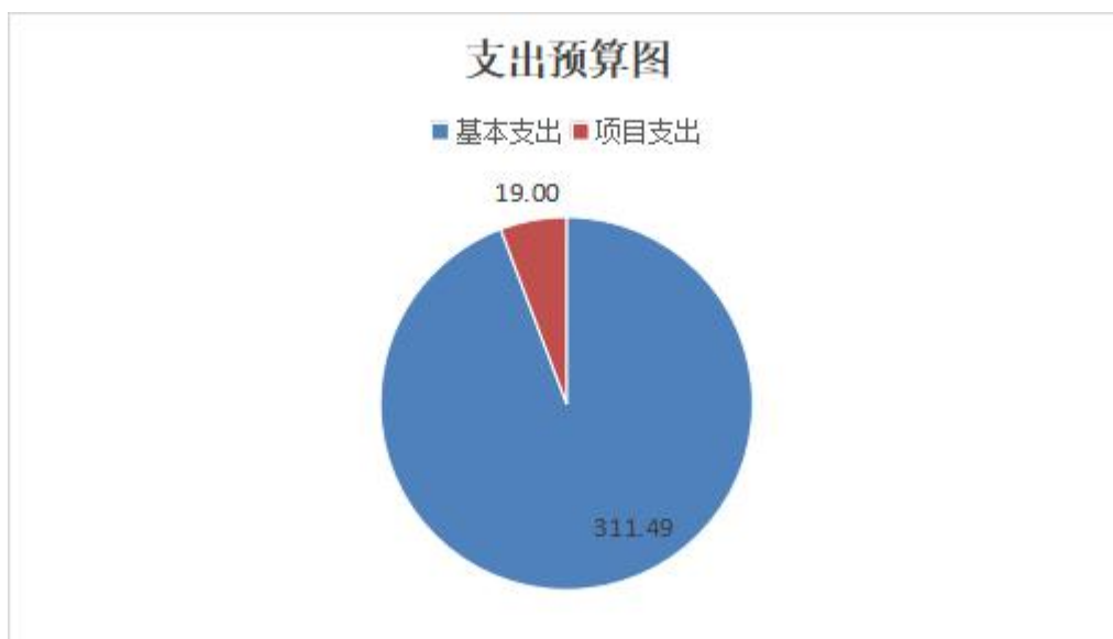
图 2. 支出预算图（可以饼图列示）