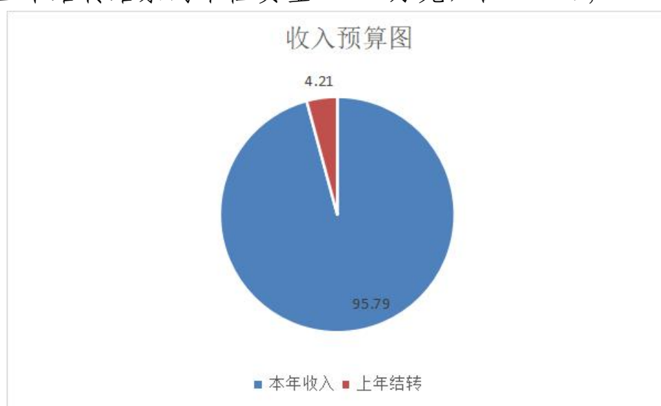
图 1. 收入预算图 (可以饼图列示)

本年其他收入 0.00 万元，占 0.00%； 上年结转结余的一般公共预算收入 50.98 万元，占 4.21%； 上年结转结余的政府性基金预算收入 0.00 万元，占 0.00%； 上年结转结余的国有资本经营预算收入 0.00 万元，占 0.00%； 0.00%； 上年结转结余的财政专户管理资金 0.00 万元，占 0.00%； 上年结转结余的单位资金 0.00 万元，占 0.00%；